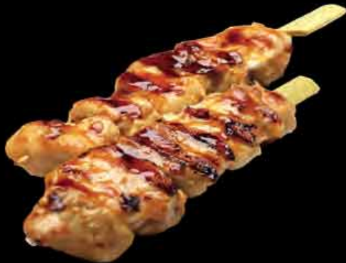
(20) Yakitori 3,50 € aus Hühnerkeule chicken thigh