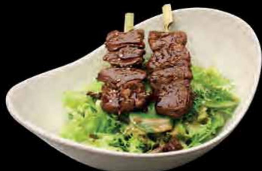
Salat mit Rindfleischspießen 9,13 6,90 € salad with beef skewers

Alle Salate werden mit Sesamdressing serviert