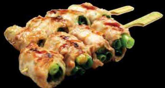
(31) Schweinefleisch mit 3,90 € Lauchzwiebeln pork with chives

- mit Sojasoße und Sesam verfeinert - ab 4 Spießen servieren wir mit Reis & Dips