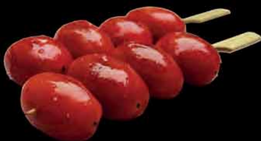
12 Cherrytomaten 2,50 €