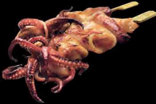
62 Tintenfisch 7 4,50 € squid