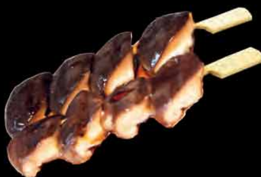
13 Shiitake Pilze 3,50 € shiitake mushrooms