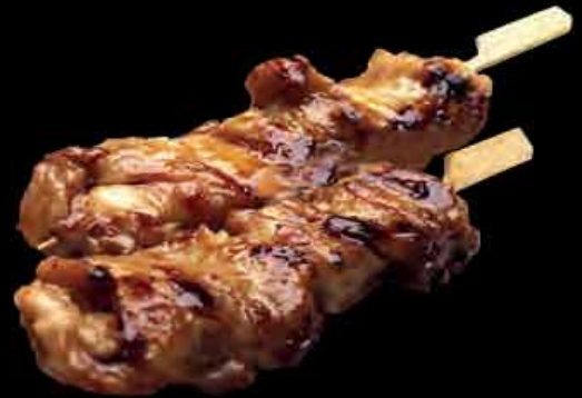
(21) Tebasaki - Hühnerflügel 3,90 € chicken wings