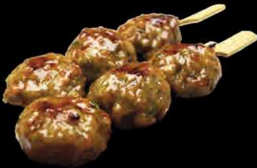
(22) Hühnerfleischbällchen 3,90 € chicken meatballs