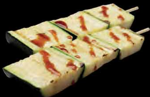
10 Zucchini 2,50 €