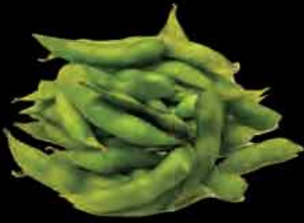
Edamame 9 3,50 € frische Soyabohnen steamed young soy beans