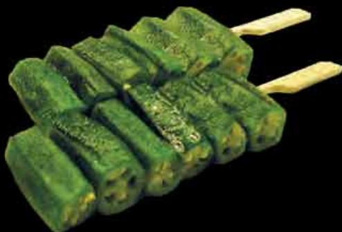
14 Okra 2,50 €