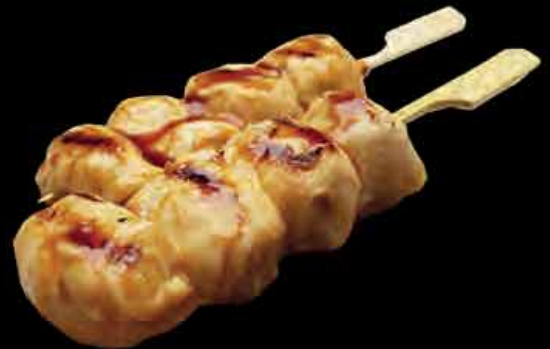
(23) Chicken Hawaii 3,90 € chicken with pineapple