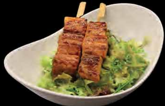
Salat mit Lachsspießen 5,9,13 6,90 € salad with salmon skewers