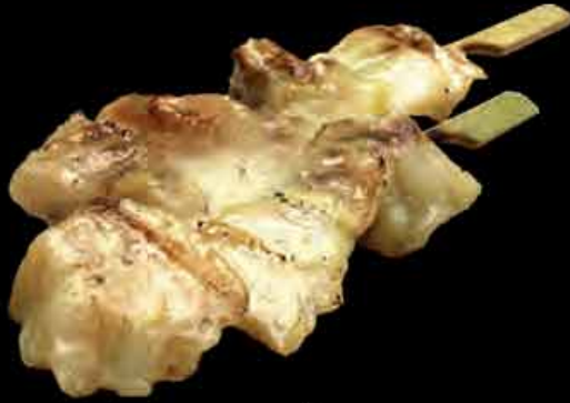
60 Rotbarschfilet 5 4,00 € redfish filet