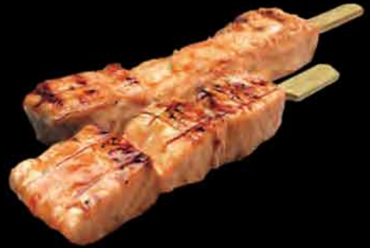
61 Lachs 5 4,50 € salmon