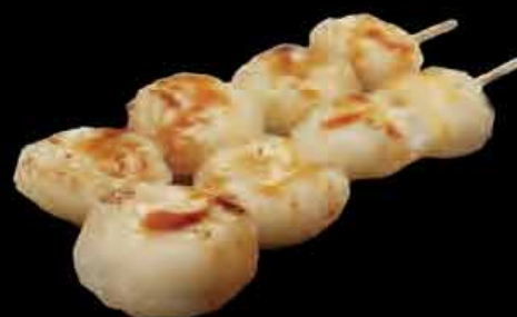
11 Wasserkastanien water chestnut 3,00 €