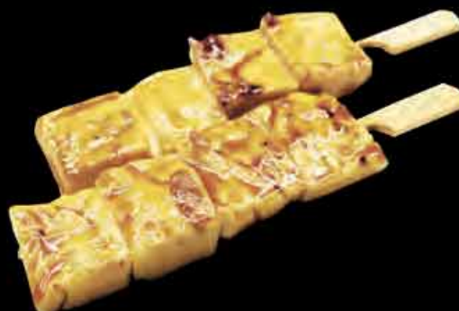
15 Tofu 9 2,50 €