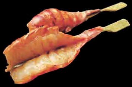
63 Großgarnelen 6 4,50 € king prawn

- mit Sojasoße und Sesam verfeinert - ab 4 Spießen servieren wir mit Reis & Dips