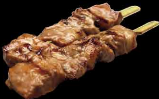
(30) Schweinefleisch 3,50 € pork