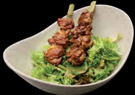
Salat mit Yakitori Spießen 9,13 5,90 € aus Hühnerkeule salad with chicken thigh skewers