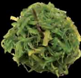
Seetangsalat 9,13,20 3,50 € seaweed salad